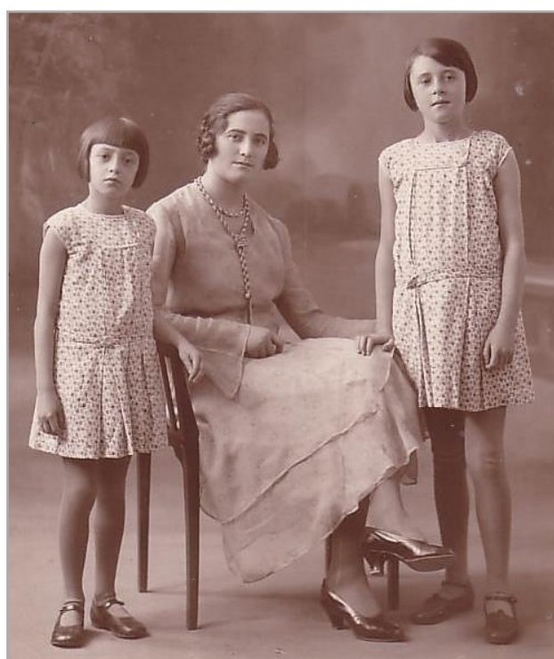
Maman jeune fille et deux petites cousines (sépia début années 1930).