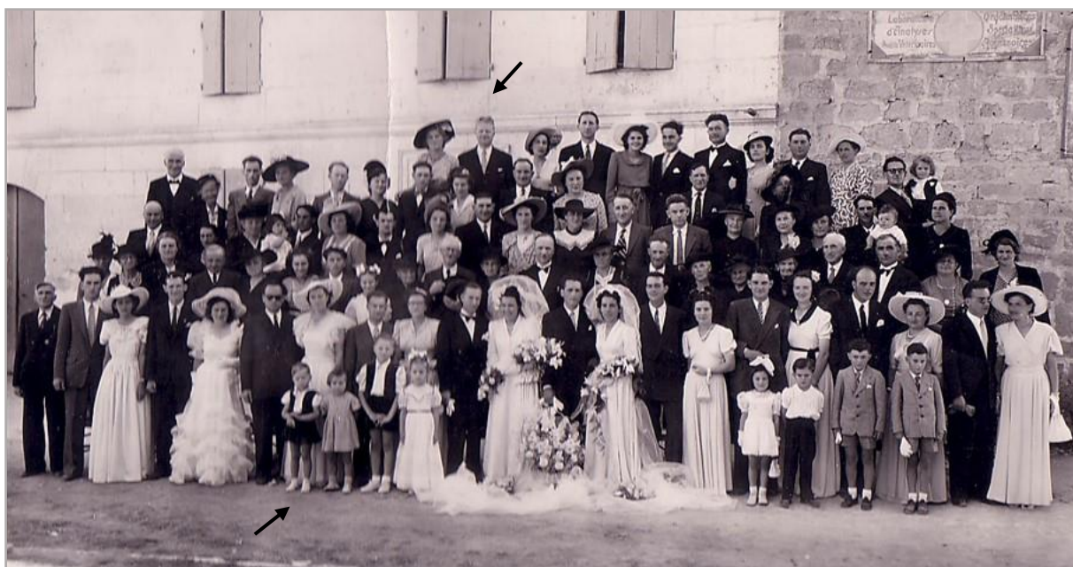
Photo officielle du double mariage citadin en présence des deux mariées, de leurs conjoints et des invités. La flèche du haut, papa et maman. Flèche du bas, deux garçonnetts d'honneur : moi-même et mon frère aîné. Le décalage d'âge et les habits que nous portons, des boléros de velours bleu selon mes souvenirs, attestent de notre présence. Ainsi que notre sœur aînée, la jeune fille avec les couettes, juste au-dessus. Les couettes sont un indice. Par contre, si j'ai en tête le bleu de nos boléros, je n'ai absolument aucun souvenir de cet instant. Ma taille situe ce mariage début années 1950.